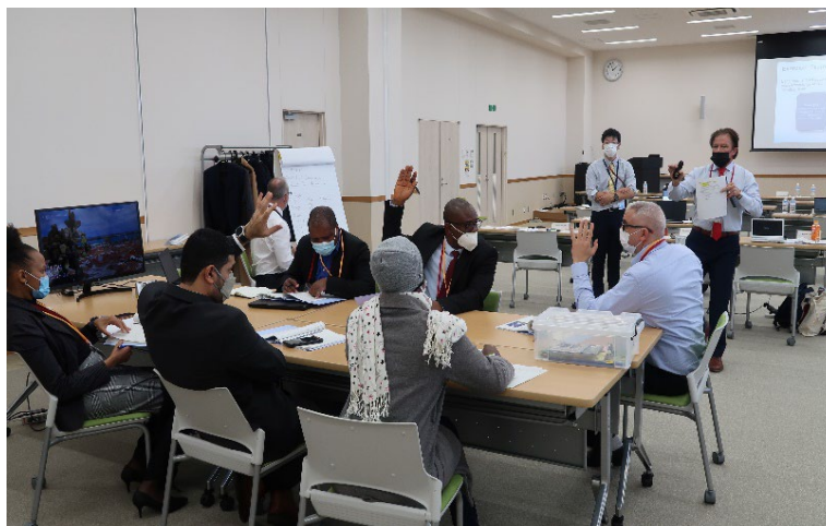
グループ演習の様子

本コースは、教室での講義のみでなく、シナリオに基づいたグループ演習やエクササイズに参加することで、輸送中の放射性物質のセキュリティ確保に必要な理解や放射性物質の特性、セキュリティ機能、管理、安全性とセキュリティの連携等について包括的な見識を得ることを目的として開催され、13か国(アルジェリア、アルメニア、ガーナ、マラウィ、ナイジェリア、オマーン、ソマリア、南アフリカ、トルコ、タンザニア、ウズベキスタン、ベトナム、ジンバブエ)の原子力規制機関、関係政府機関及び原子力事業者等から13名が参加した。