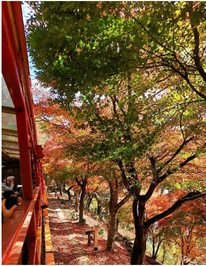
Romantic Train in Saga-Torokko,

Places I've been to are Hitachi Seaside Park, Kairakuen Garden, Nakaminato Fish Market, Mitokomon festivals at Senbako, Fukuroda Waterfall, Oarai Beach, Osaka, Kyoto, and Nikko, Yokohama: Chinatown, Red Brick Building, Cup Noodle Museum, Tokyo: Asakusa, Yamato Ginza, Shibuya, Shinjuku. I'm glad I visited those places, but I still want to explore more of Japan. Hopefully, I could visit Japan again in the near future.