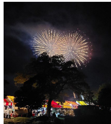
Beautiful Fireworks at Senbako

how safe Japan is, I went everywhere mostly alone, even at night or sometimes at dawn, I felt safe. Even though trash segregating is still confusing for me sometimes, and the bus doesn't have numbers, I coped well by learn to memorize the distinct shape of the letters and google translating every words. It actually motivates me to learn Japanese in the future. What I really love from Japan is the people, even though from the outside they looks like a cold person, but every time I asked for helps, I have always kindly assisted with the smile. All my colleagues at ISCN are also very friendly and always offer to help me without being asked. Their patience, openness, and tolerance create a very enjoyable work environment.