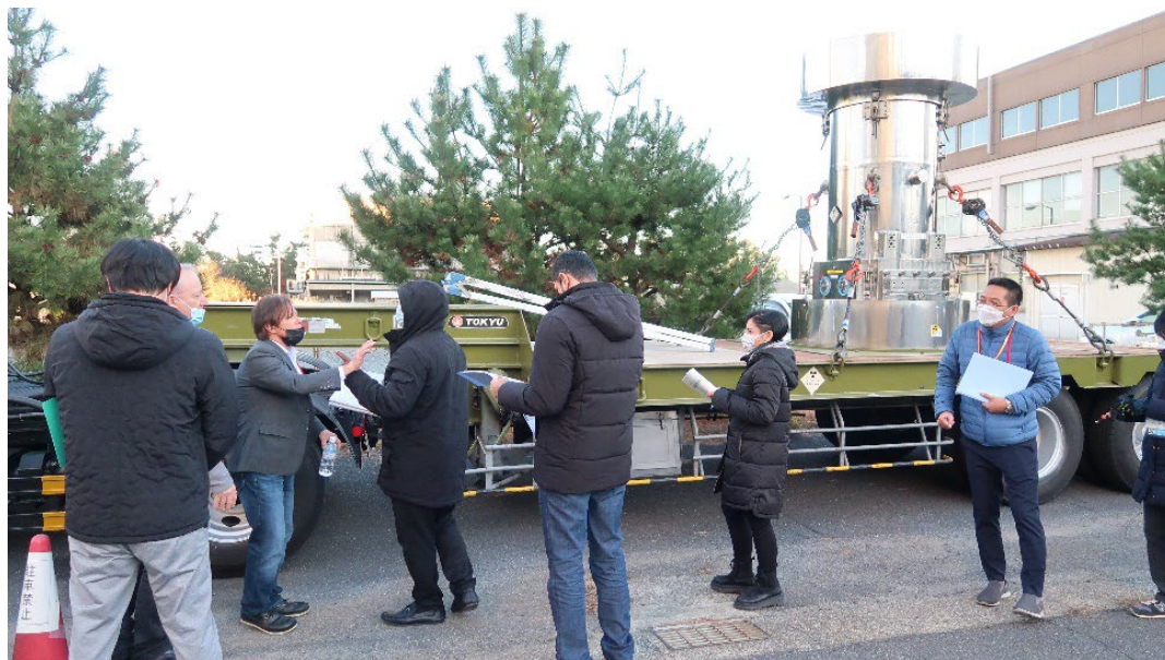
輸送車両、輸送容器を用いたエクササイズの様子

る。また、核物質防護実習フィールドの見張人詰所(CAS: Central Alarm Station)においては、侵入を検知するセンサーや監視カメラの性能及び特徴についても学ぶ機会を提供することができた。