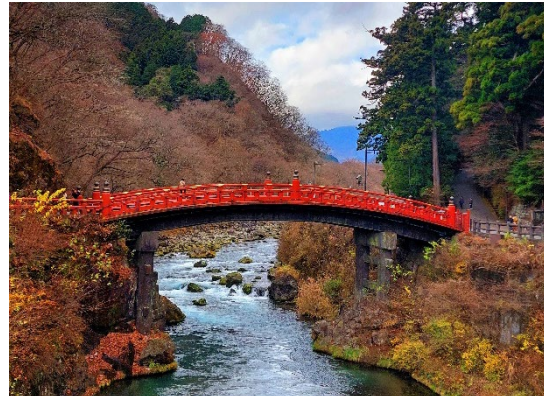
Sacred Shinkyo Bridge