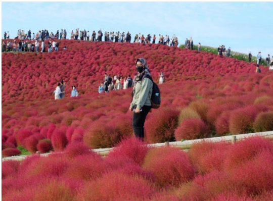
Fairytale-like, Hitachinaka Seaside Park