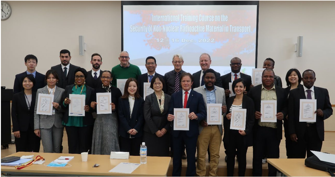
修了式での集合写真